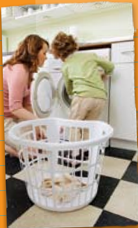
用请他们帮助您一起做家务的方式来发展与他们的亲情。