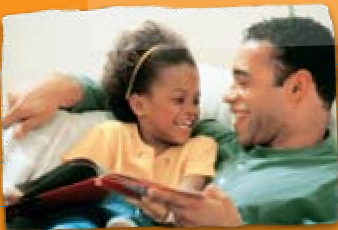
每天都读书给他们听，发展与他们的亲情。