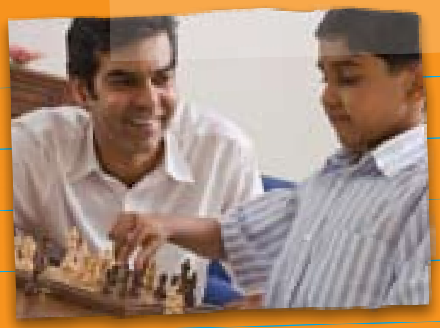
用与他们一起玩他们喜欢的游戏的方式来发展与他们的亲情。