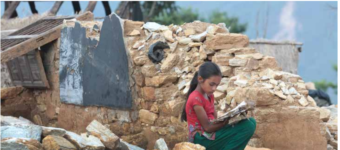
गोरखामा भत्किएको घर माफ भेटिएको किताब पढ्दै एक बालिका ।

राहत सामग्रीहरू अनियमित तरिकाले वितरण भएको र राजनीतिक सम्पर्क भएकाहरूले राहतमा शीघ्र र सहजपूर्वक पहुँच गरेको कुरा असन्तुष्टी व्यक्त गर्ने बालबालिकाहरूमध्ये आधाभन्दा धेरैलाई लागेको कुरा अभिव्यक्त गरेका थिए । अरु कतिपयले चाहिँ उनीहरूले वा सीमान्तकृत वा दुर्गम समुदायहरूले राहतमा पहुँच पाउन कठिनाई भएको बताएका थिए भने केही घटनाहरूमा उनीहरूले कुनै पनि सहायता नपाएको कुरा भनेका थिए ।