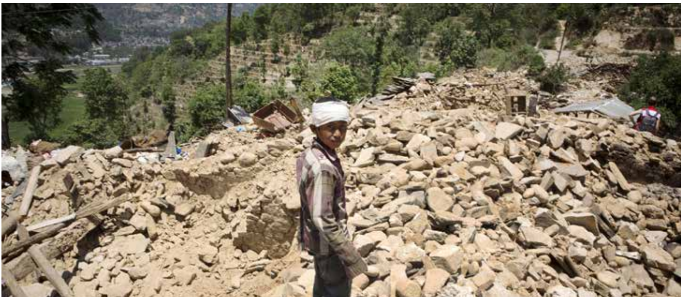
भूकम्पले भत्काएको आफ्नो घर देखाउँदै एक बालक ।