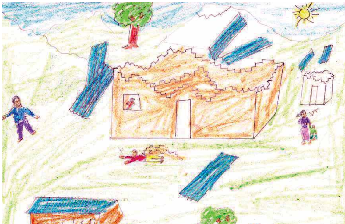
भूकम्प पछि आफ्नो गाँउमा भएको विनाश देखाउन चित्र कोर्दै एक बालक ।

बालबालिकाहरूका लागि आश्रय, शिक्षा, स्वास्थ्य र सरसफाई प्राथमिक सरोकारका विषयहरूका रूपमा अगाडि आए भने एच-लेखाजोखा, अभिव्यक्तिमूलक चित्रांकन र शरीर नक्शांकन अभ्यासहरूमा भूकम्पहरूका व्यापक प्रभावहरू सम्बन्धमा पनि छलफल गरिएका थिए । ती अभ्यासहरूमा सहभागी बालबालिकाहरूले वयान गरेका मुख्य कुराहरू निम्न थिए :