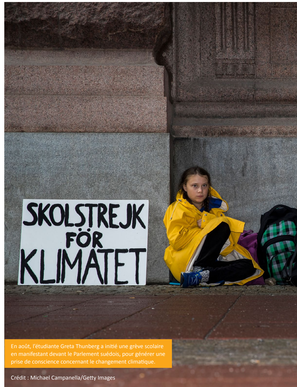
En août, l’étudiante Greta Thunberg a initié une grève scolaire en manifestant devant le Parlement suédois, pour générer une prise de conscience concernant le changement climatique.

Ces exemples inspirants – et bien d’autres abordés dans notre rapport – ont montré que les gens ont le pouvoir d’insuffler le changement, aussi bien par l’action individuelle que par les organisations que nous formons