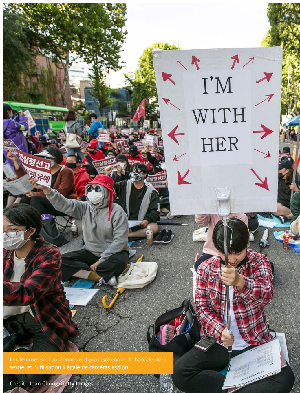
Les femmes sud-coréennes ont protesté contre le harcèlement sexuel et l'utilisation illégale de caméras espion.

Bien que l'année ait été marquée par des moments inspirants au cours desquels les gens se sont levés pour contester leur propre exclusion, comme ce fut le cas des mouvements #MeToo au Cameroun, au Chili et en Corée du Sud, il y a aussi eu de nombreux cas où des groupes privés de droits et de voix de longue date ont été attaqués, ainsi que la société civile qui les défend. Ils l'ont été car ils défient le pouvoir des élites économiques et politiques, tant les anciennes élites qui ont bénéficié de décennies de néolibéralisme économique mondialisé que les nouvelles élites des dirigeants populistes de droite qui promeuvent un nationalisme économique strict. La société civile qui défend les droits des femmes a été attaquée parce qu'elle remet en question les relations de pouvoir économique et les bases de soutien conservatrices de nombreux