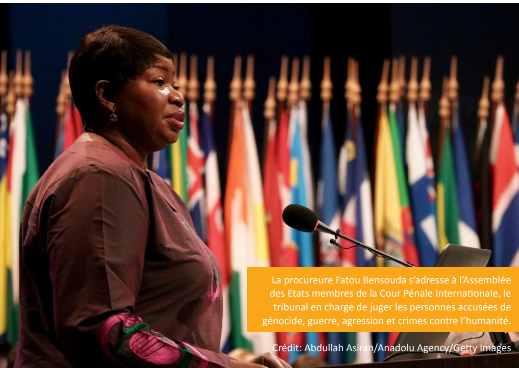
La procureure Fatou Bensouda s'adresse à l'Assemblée des États membres de la Cour Pénale Internationale, le tribunal en charge de juger les personnes accusées de génocide, guerre, agression et crimes contre l'humanité.