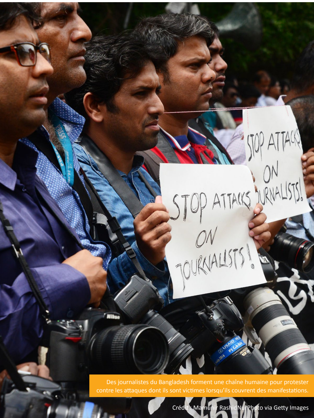
Des journalistes du Bangladesh forment une chaîne humaine pour protester contre les attaques dont ils sont victimes lorsqu'ils couvrent des manifestations.