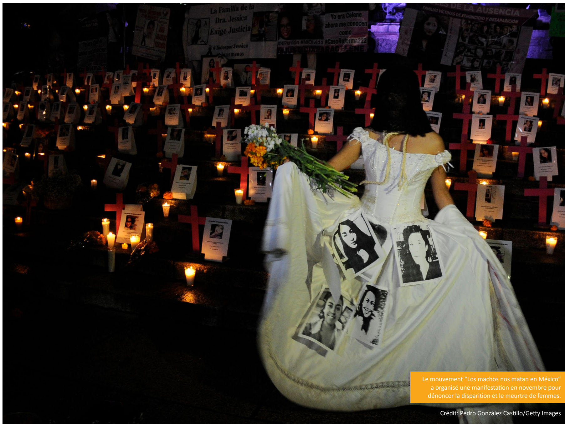
Le mouvement "Los machos nos matan en México" a organisé une manifestation en novembre pour dénoncer la disparition et le meurtre de femmes.