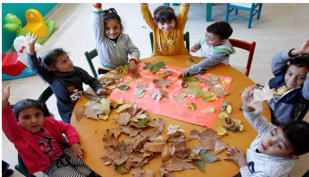
Daily activity with children in kindergarten in Albania

también incluye seguirle la corriente a las organizaciones que representan y están dirigidas por personas en mayor riesgo de desigualdad y discriminación en el sistema educativo, como OPD, grupos de derechos de la mujer y grupos de idiomas minoritarios, muchos de los cuales han trabajado en estas áreas durante mucho más tiempo que nosotros. También supone comunicarse entre sectores para garantizar que las niñas y los niños en riesgo de desigualdad y discriminación en el sistema educativo también estén respaldados a través de iniciativas de salud y protección.