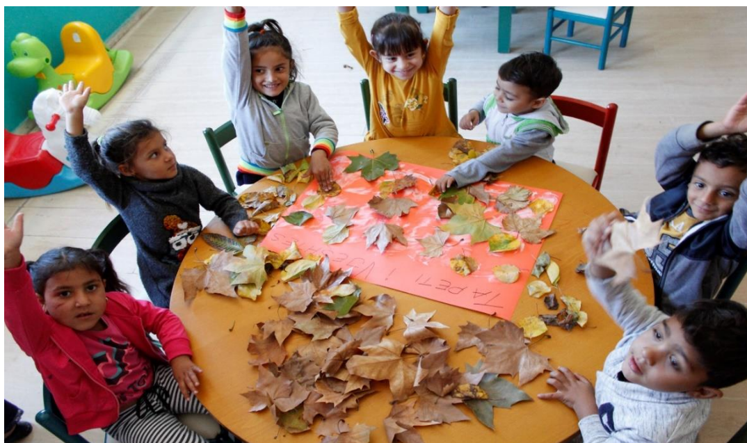
Activité quotidienne avec des enfants dans une maternelle en Albanie

minoritaires, dont beaucoup travaillent dans ces domaines depuis bien plus longtemps que nous. Il s'agit également d'établir des liens entre les différents secteurs afin de s'assurer que les enfants exposés à l'inégalité et à la discrimination dans le système éducatif sont également soutenus par des initiatives de santé et de protection.