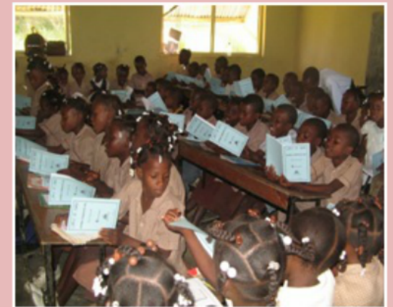
Lekti se Lavni en escuelas

La oficina de Jacmel, se unirá con el programa Lekti se Lavni/Lire c'est L'avenir, un programa innovador de alfabetismo Criollo y Francés, él cual fue fundado con el principio de ayudar a los niños y niñas a desarrollar su capacidad de lectura en su idioma natal. Nuestros equipos del Departamento Oeste y de Dessalines actualmente apoyan escuelas usando esta técnica.