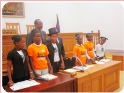
Uno de los clubes de SC en el parlamento