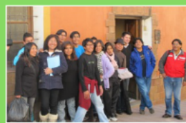
Delegación de jóvenes de La Paz llegando a Potosí