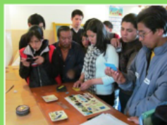
Jóvenes de La Paz en la escuela de platería del Ingenio Ichu

Save the Children coordina con los Servicios Departamentales de Salud para que se proporcionen suplementos a los niños en las escuelas y centros de salud. Este proyecto cuenta con el apoyo financiero de la empresa UNILEVER y la fundación de la familia KARLSSON y tendrá una duración de 3 años.