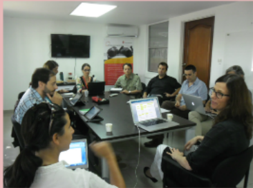
Asistentes a la reunión inter-agencial sobre Joint.