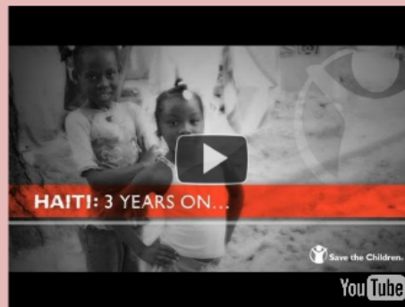
SC en Haiti- 3 años después del terremoto