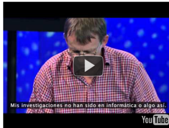
Hans Rosling revela nuevas ideas acerca de la pobreza

TED TALKS / Videos interesantes sobre el desarrollo y trabajo humanitario