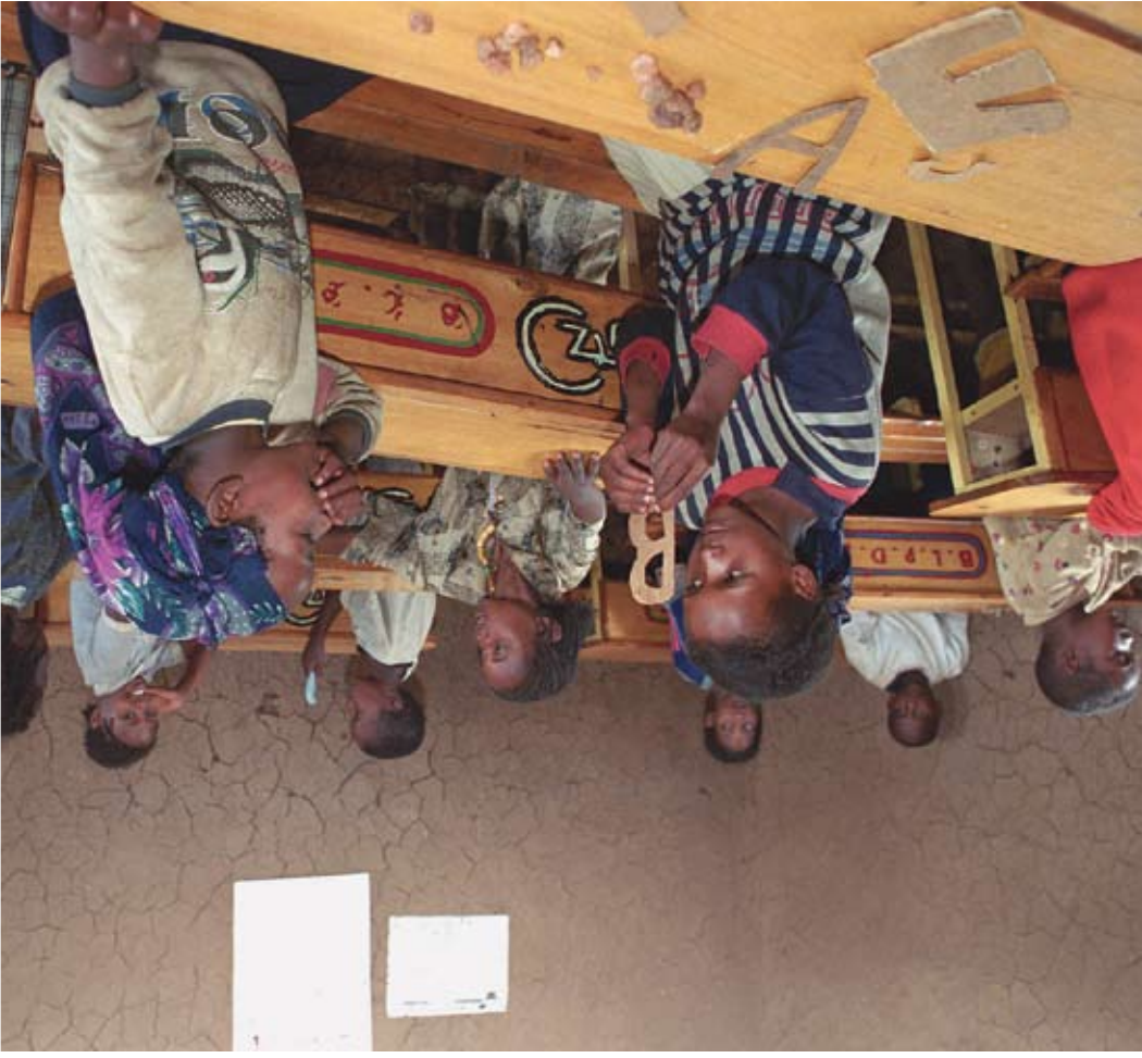
ETHIOPIE/Photo par Michael Biscoglio