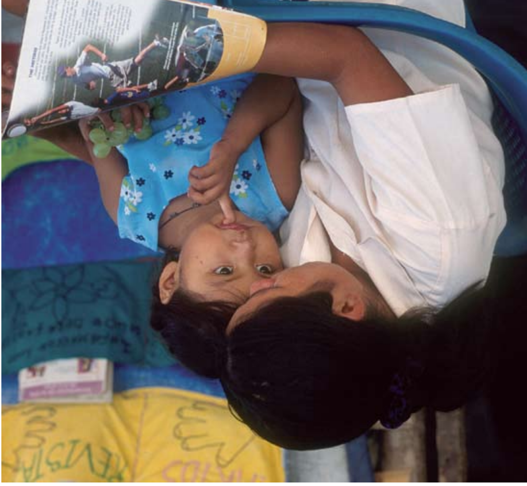
EL SALVADOR

Juste avant le lit est un moment idéal pour lire à votre enfant