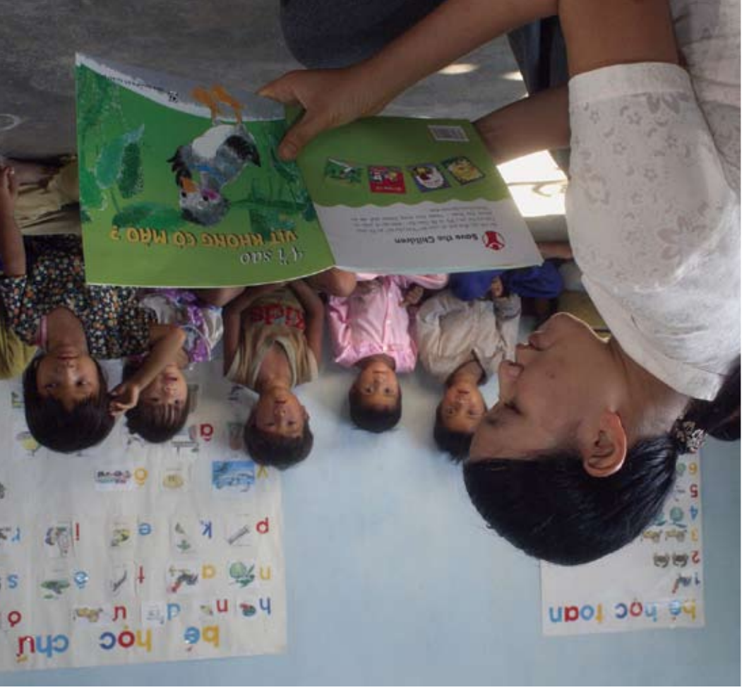
AiIsaasig Vietnam