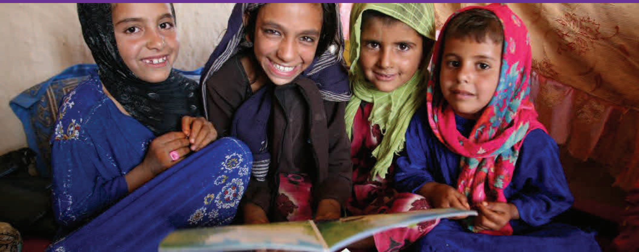
AFGHANISTAN/Photo by Jeff Holt