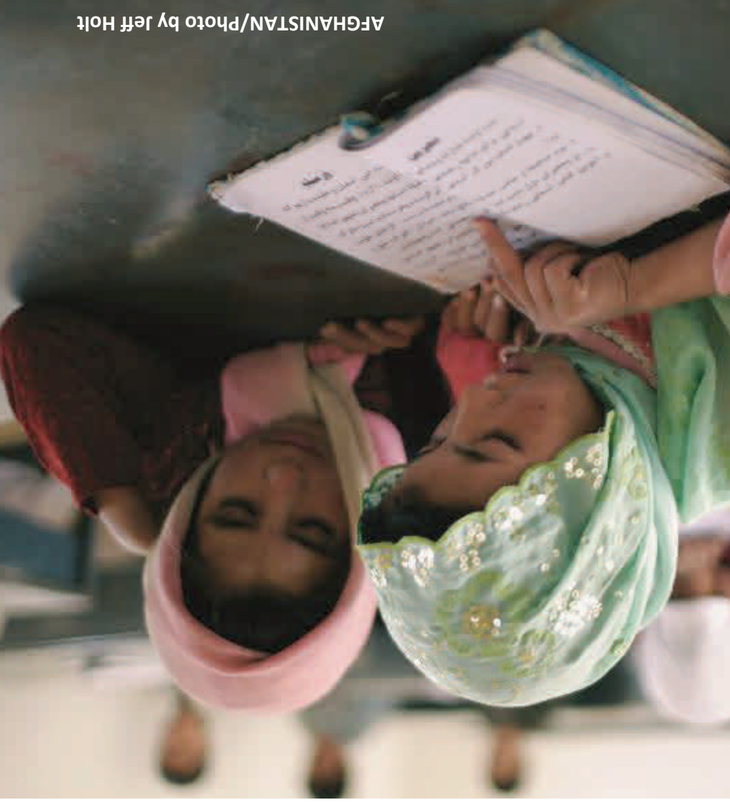
AFGHANISTAN/Photo by Jeff Holt