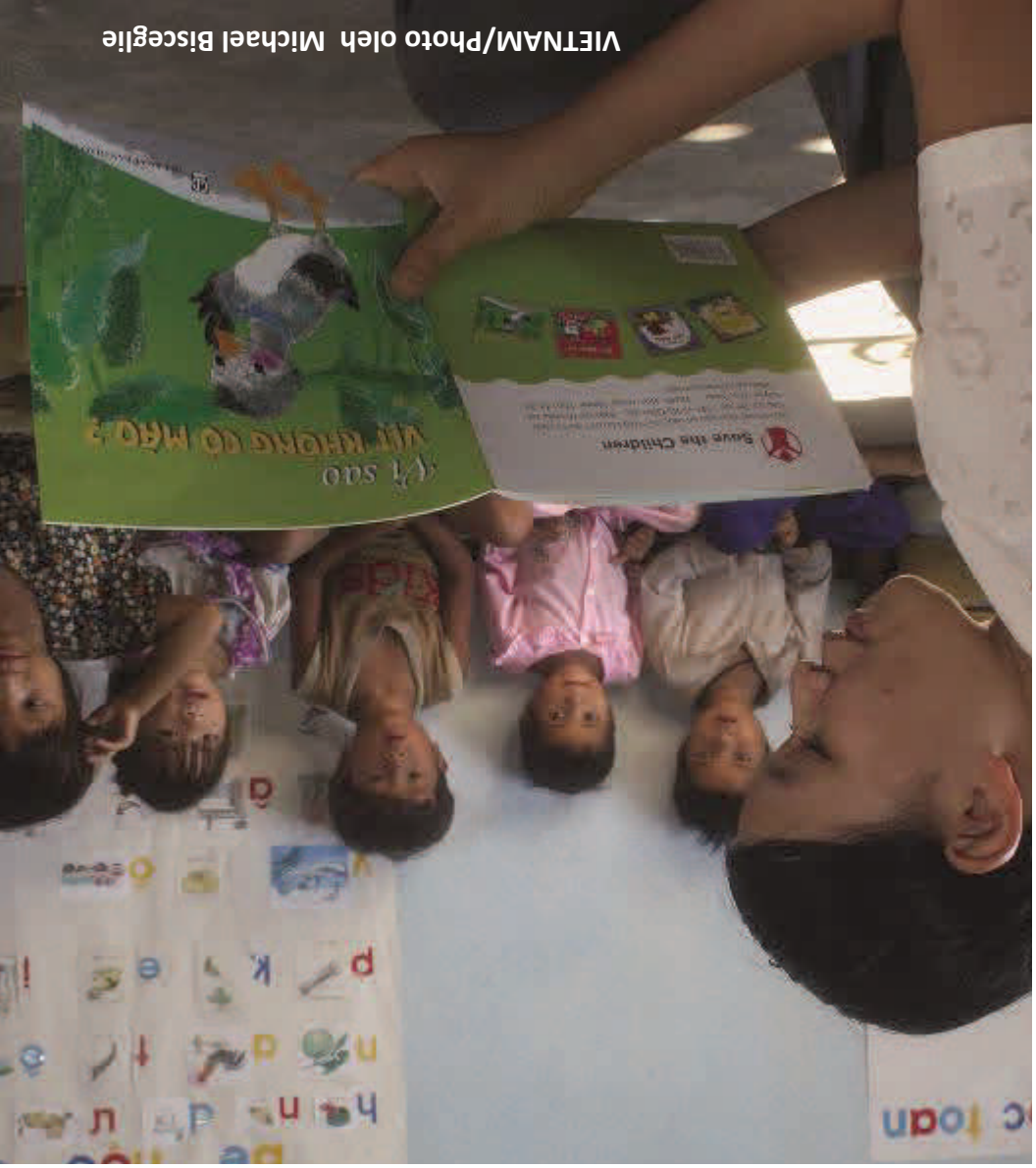
VIETNAM/Photo oleh Michael Bisceglie